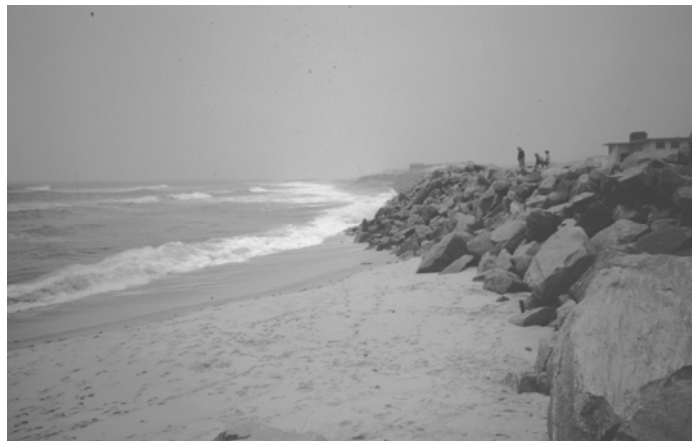
Foto 5 – Exemplo de uma estrutura pesada de protecção, aderente ao litoral e o parcial desaparecimento da praia, no Norte de Portugal.