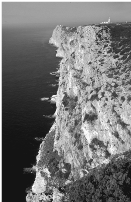
Foto 2 – O escarpado litoral em rochas calcárias, na Arrábida meridional (ao fundo o farol do Cabo Espichel).