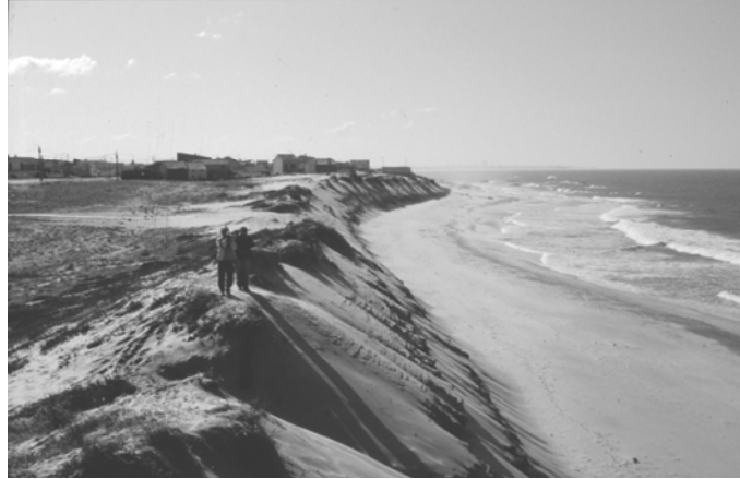
Foto 4 – Litoral arenoso em erosão, no Norte de Portugal (notar o declive exagerado da face barlavento da duna (prova clara do regime de erosão)).

nas barragens e represas. Estas, não só retêm os sedimentos como, ao fazer diminuir o número de cheias e a sua magnitude, diminuem a capacidade de transporte dos rios, que assim carregam poucos sedimentos até ao litoral (fotos 4,5 e 6).