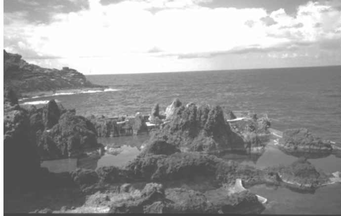
Foto 1 – O modelado litoral em rochas vulcânicas, na ilha da Madeira.

Do primeiro fazem parte a natureza das rochas (magmáticas, como os granitos ou os basaltos - foto1; sedimentares como os calcários - foto2; metamórficas como os xistos - foto3, por exemplo) e a sua estrutura ou disposição.