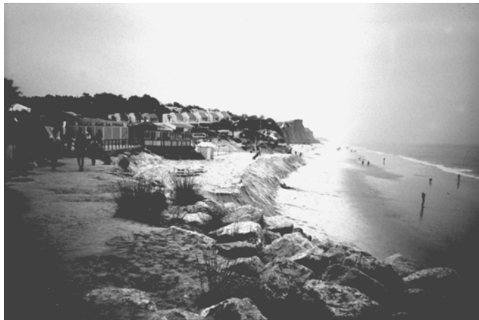
Foto 7 – Vale do Lobo, no Algarve, onde, devido à erosão, foi construída uma estrutura de protecção (em primeiro plano) e se faz alimentação artificial da praia, de onde o mar já levou grande parte da areia (como evidência o degrau de areia na praia).

Todos estes processos da dinâmica litoral são de há muito conhecidos pelos especialistas (embora haja ainda muito para investigar), mas foram ignorados pelos responsáveis pelo ordenamento e gestão do território nacional.