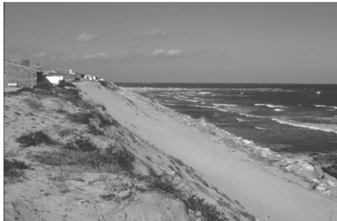
Foto 6 – Litoral em erosão com estruturas pesadas longitudinal e transversal de protecção, no Norte de Portugal.

Mas não só o ordenamento das bacias hidrográficas tem repercussões no litoral. O homem ao ordenar (ou desordenar) o espaço litoral pode causar idênticos impactes.